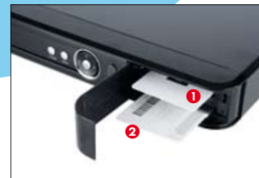
Die „HD+“-Abokarte 1 kommt in den oberen Schlitz. Der Empfang von Sky per CI+-Modul 2 klappt nicht.

Der Empfang aller unverschlüsselten HDTV-Angebote klappte in knackscharfer Qualität. Bei öffentlich-rechtlichen Programmen (Sendeformat: 720p*) waren Kanten in Bewegungen etwas unsauber. „HD+“-Sender wie RTL HD entschlüsselt die beiliegende Smartcard. Aufnahmen von HD+ lassen sich beim Angucken nicht vorspulen und sind verschlüsselt, sodass sie sich nicht per Computer auf DVD archivieren lassen – was bei Aufnahmen anderer Sender klappt. Innovativ sind die Internetfunktionen: „Catch Up TV“ liefert bei den Programmen der ARD einen Vi-